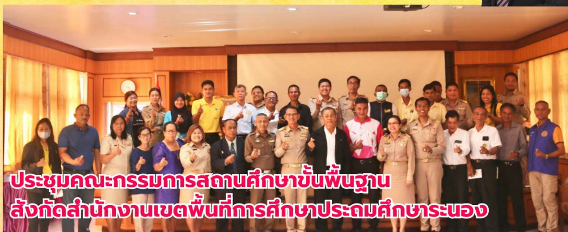
ประชุมคณะกรรมการสถานศึกษาขั้นพื้นฐาน สังกัดสำนักงานเขตพื้นที่การศึกษาประถมศึกษาระนอง