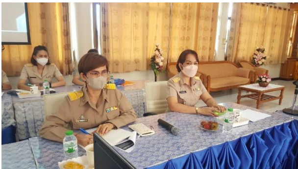
การประชุมเชิง ปฏิบัติการการ ประเมิน