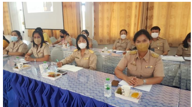
คุณธรรมและความโปร่งใสของการดำเนินงาน

ของสำนักงานเขตพื้นที่การศึกษาประถมศึกษาพระนครศรีอยุธยา ประจำปีงบประมาณ พ.ศ. ๒๕๖๕ วันที่ ๕ กรกฎาคม ๒๕๖๕ ตั้งแต่เวลา ๐๘.๐๐ น. ณ ห้องประชุมปะการัง สพ.พระนครศรีอยุธยา